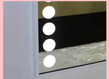
発光部分：サークルタイプ LED色：昼白色