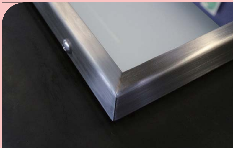
製品タイプ：フレームあり 鏡の外周がステンレスフレームで覆われます。