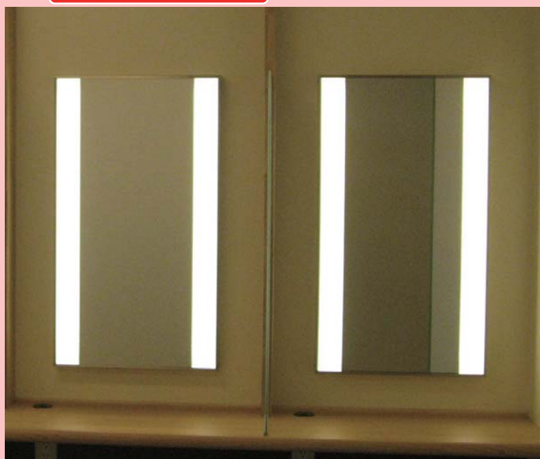
設置場所：温泉施設 サイズ：W510 x H900 x D50