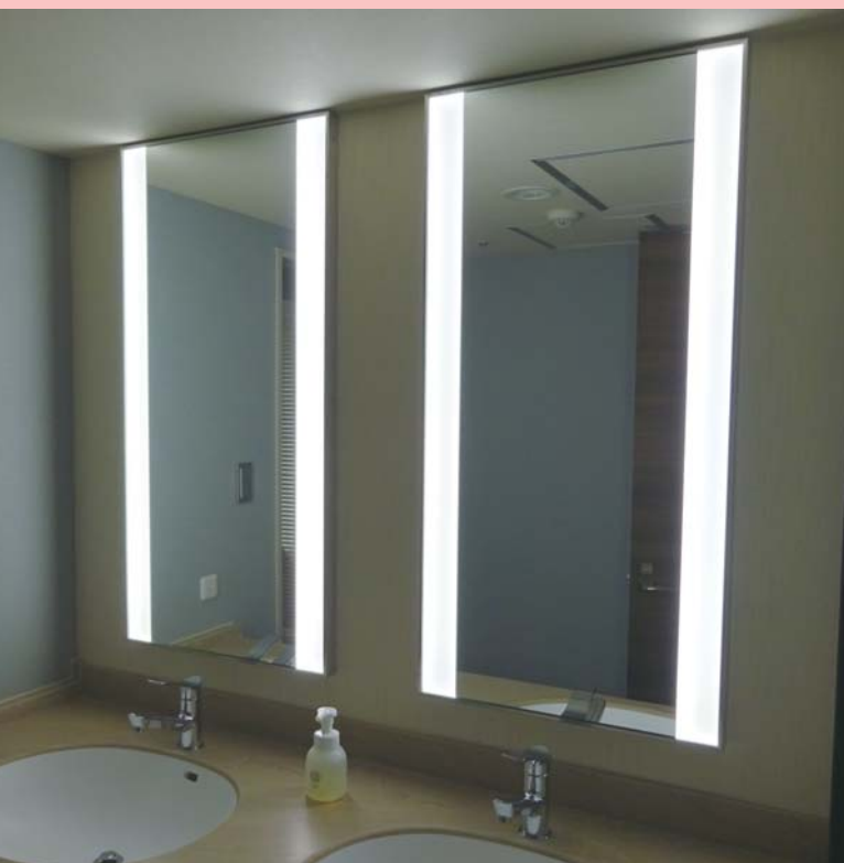
設置場所：リッチモンドホテルプレミア 東京押上 設計：大成建設 栗野寛史 / 大澤恵里子 (敬称略) サイズ：W550 x H1115 x D35