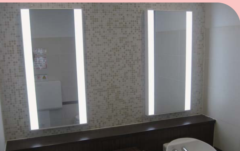
設置場所：駅ビル・化粧室 サイズ：W500 x H1000 x D60