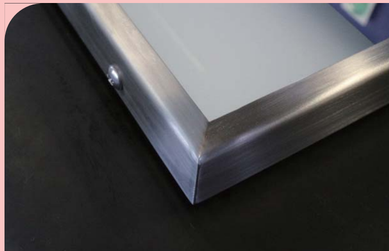
製品タイプ：フレームあり 鏡の外周がステンレスフレームで覆われます。

照明を化粧鏡に内蔵 フラットかつ柔らかい間接光で まぶしさを軽減 薄型でスマートな外見