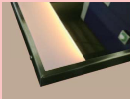
発光部分：スクエアタイプ LED色：電球色