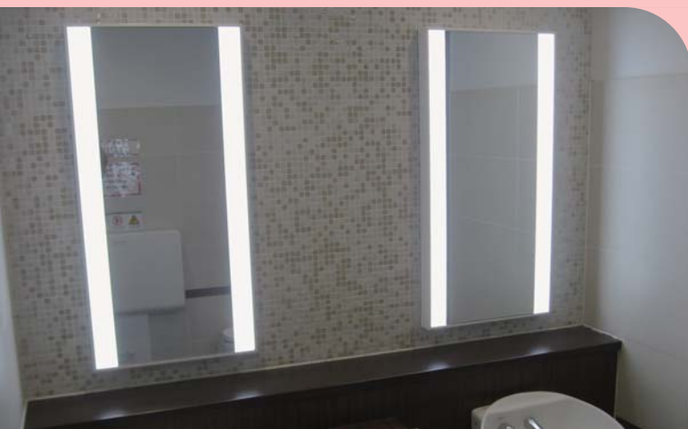
設置場所：駅ビル・化粧室 サイズ：W500 x H1000 x D60