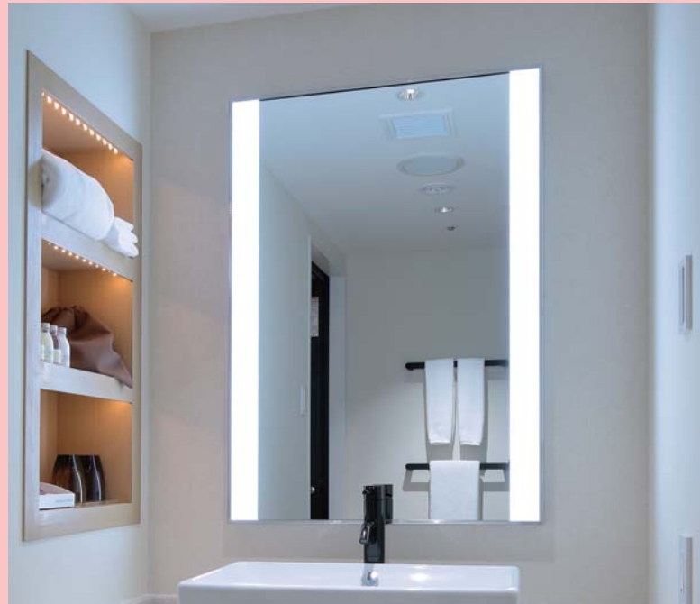
株式会社グランビスタ ホテル&リゾート様 設置場所：ホテルインターゲート京都 四条新町 サイズ：W700 x H1000 x D35