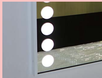
発光部分：サークルタイプ LED色：昼白色