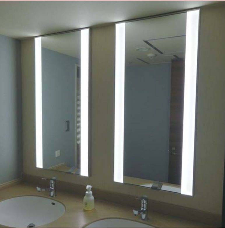
設置場所：リッチモンドホテルプレミア 東京押上 設計：大成建設 栗野寛史 / 大澤恵里子 (敬称略) サイズ：W550 x H1115 x D35