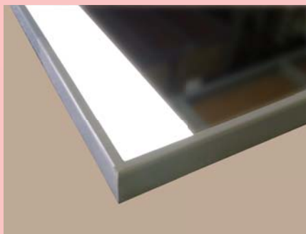
発光部分：スクエアタイプ LED色：昼白色

発光部分 スクエア：長方形の発光、光量豊富なスタンダード照明 | サークル：ハリウッドミラーのような外観