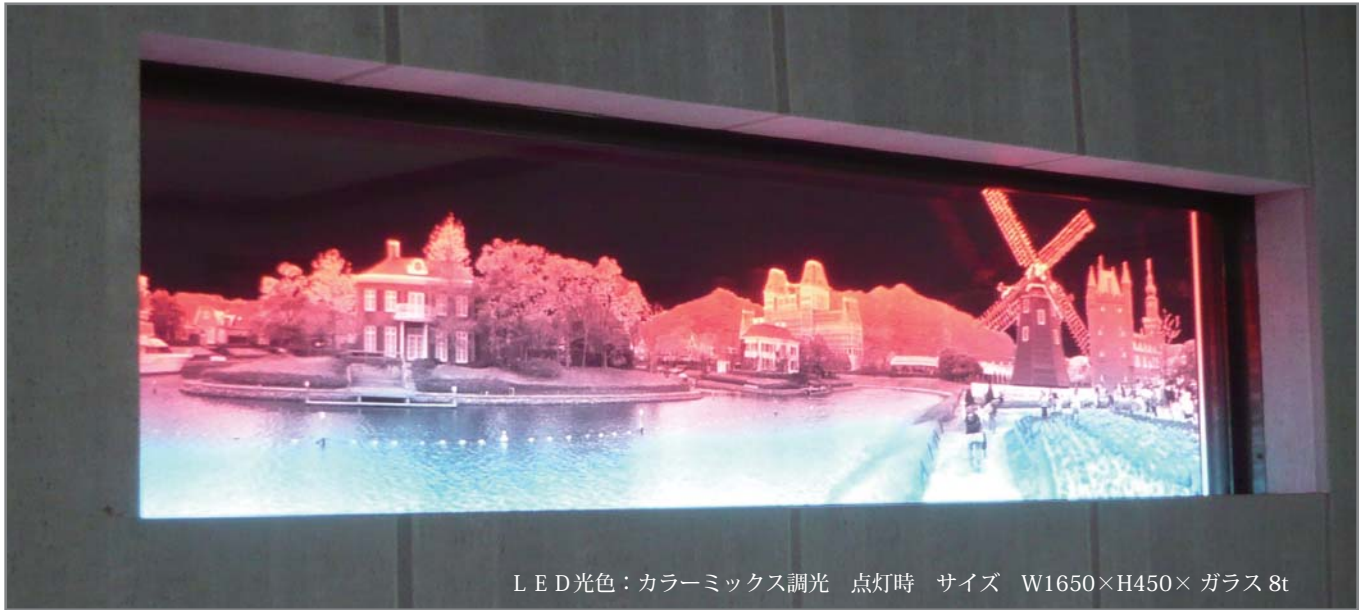
LED光色：カラーミックス調光 点灯時 サイズ W1650×H450× ガラス 8t