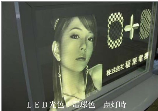
LED光色：電球色 点灯時