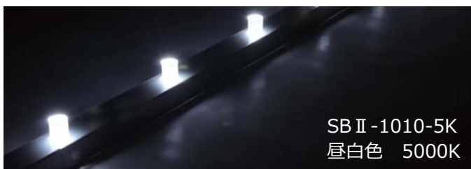
SB II -1010-5K 昼白色 5000K